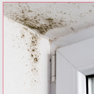
PITTURE MURALI E PARETI INTONACATE