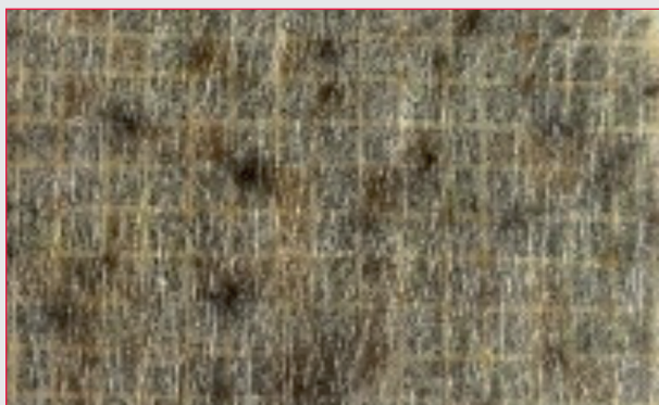
Campione non trattato e contaminato

Trattamento preventivo contro la formazione di muffe , campione trattato con ACTIVE2 e non trattato di materiale edile poroso, mantenuto in ambiente saturo di umidità e favorevole allo sviluppo della muffa.