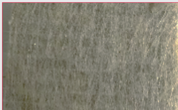
Campione trattato e sottoposto allo stress test: la muffa non si riforma