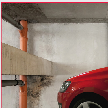
GARAGE E CANTINA

ACTIVE2 penetra con facilità nel supporto creando un ambiente sfavorevole allo sviluppo della muffa e contribuisce alla salubrità dell'ambiente nel tempo.